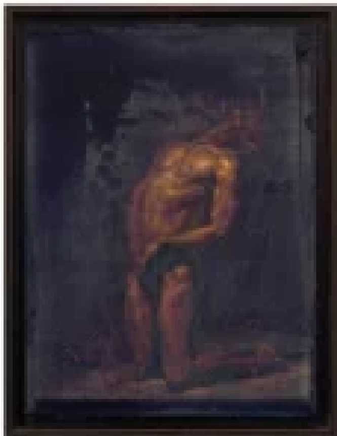
„Agonia Quadriptyc” – Ellen Marie Moysons