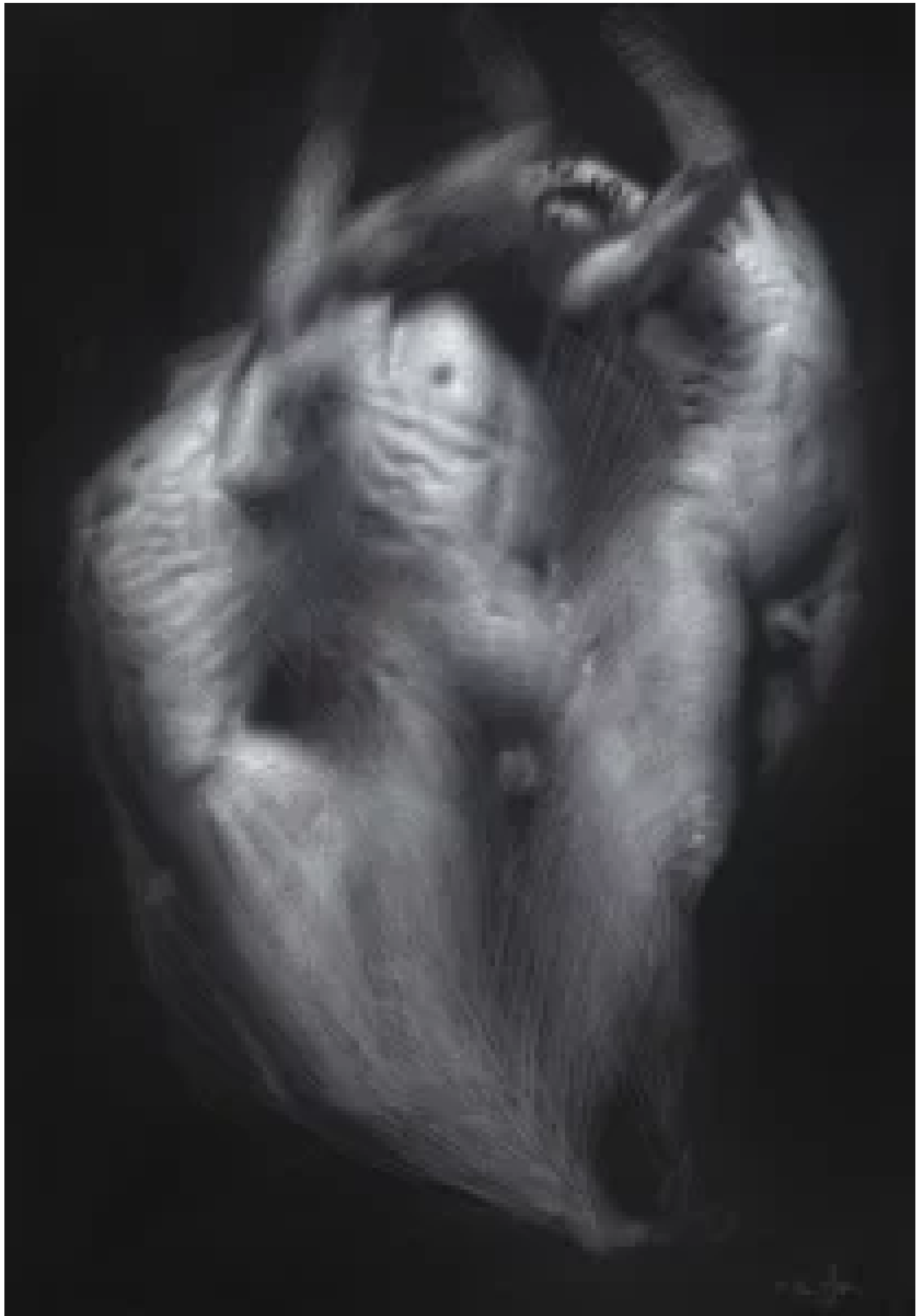
„Metamorphosis I“ – Ellen Marie Moysons