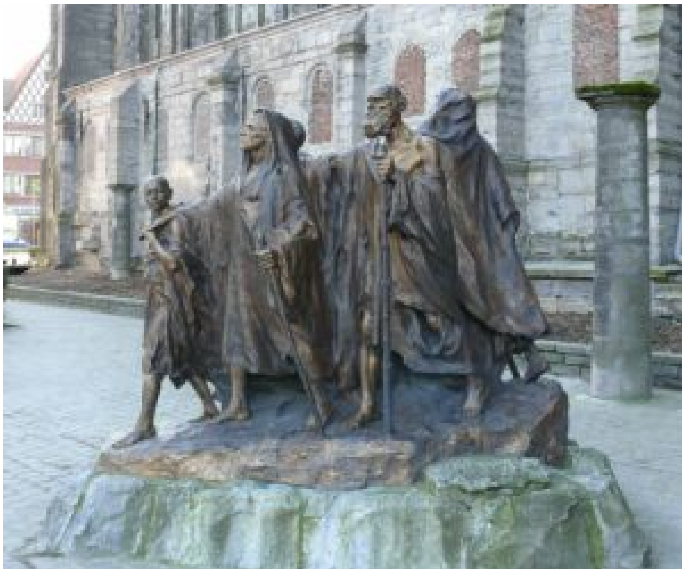
„Les Aveugles” – Guillaume Charlier

3. Ai o pregătire artistică mai degrabă clasică, ceea ce, după părerea mea, este necesar indiferent de direcția pe care un artist o alege mai târziu. Crezi că este așa sau că cineva poate fi un artist adevărat fără a avea cunoștințe solide, să zicem, de desen anatomic? De asemenea, care crezi că este raportul potrivit dintre tehnică și spirit într-o operă de artă?