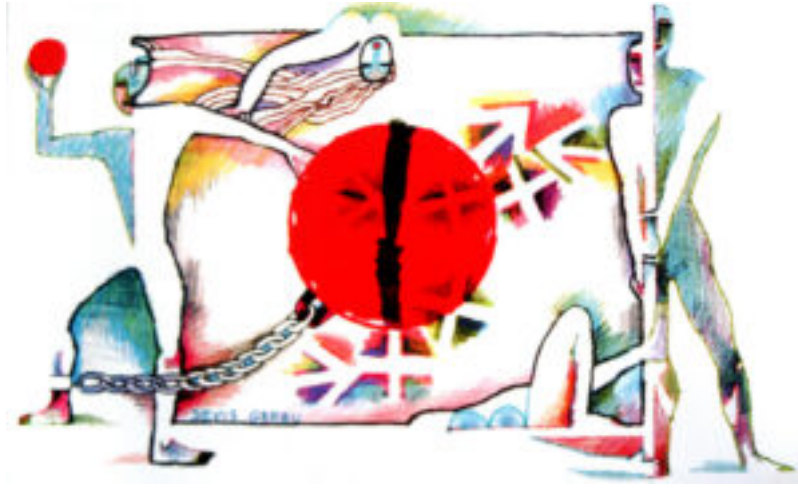
Medion DIGITAL CAMERA

În ceea ce privește ilustrațiile mele, ele reprezintă un fel de întâlnire miraculoasă – la jumătatea drumului – o chintesență între cei/cele care mi-au solicitat-o și mine!