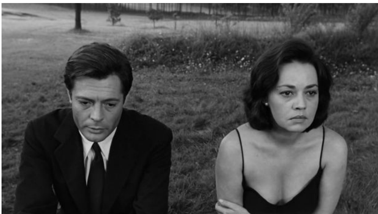
Giovanni (Marcello Mastroianni) și Lidia (Jeanne Moreau) în scena finală a filmului „La Notte”

Femeile sunt cele menite să reflecte cel mai expresiv aceste pierderi ale căror impact se resimte imediat, mai ales la nivelul cel mai fundamental, al vieții de zi cu zi. În timp ce bărbații sunt preocupați de bani (Piero), aventuri amoroase (Sandro, Giovanni), vocații ratate (Marcello), protagoniste sunt vizibil afectate de imposibilitatea unor relații interpersonale reale, ajungând la rândul lor să se folosească și să se lase folosite de diverși pretendenți. Frumusețea lor melancolică, atitudinea permanent ezitantă și pierdută, intenționat sau neintenționat seducătoare, ascunde de fiecare dată o lipsă de nădejde în viitorul relațiilor cu partenerii lor.