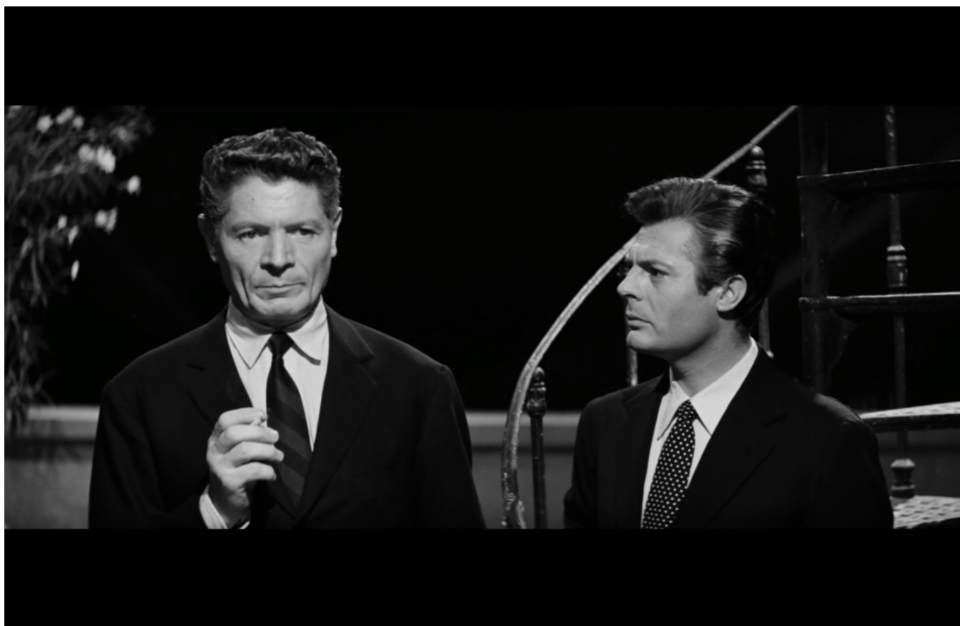
Steiner (Alain Cuny) și Marcello (Marcello Mastroianni) în „La Dolce Vita”

este o scenă candidă și singulară în peliculele pe care le discutăm - nu este vorba doar de o pasiune de moment, de îndrăgostire sau capriciu, ci despre o femeie care este dedicată trup și suflet iubitului său și este disperată când observă că dragostea lui nu este reciprocă. Încă odată ni se arată că iubirea în forma aceasta nu mai poate nici ea exista și Emma ajunge să fie tratată mai degrabă ca o nebună ce manifestă o dragoste maternă și cicălitoare, și nu ca o femeie devotată. Asemeni modelului lui Steiner, iubirea Emmei dispare din peisaj ca și cum nu ar fi existat niciodată. Faptul că afecțiunea ei ar fi putut să dăinuiește este un aspect complet neglijabil. Emmei i se poate găsi zilnic câte o altă înlocuitoare.