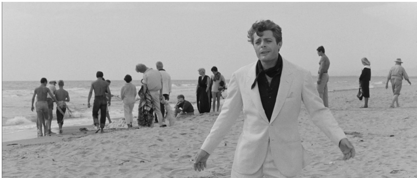
Marcello (Marcello Mastroianni) în scena finală a filmului „La Dolce Vita”

Este însă „realitatea umană” numai acea parte din experiența modernă și contemporană care ține strict de părțile inferioare ale sufletului? Îmi pare că nu, iar din acest punct de vedere, neorealismul italian pare să ia, paradoxal, forma unui romantism – suntem puși în fața unei idealizări a decadenței și ale instinctelor nestăvilite, și nu în fața unei descrieri a caracterului uman ca un amestec de nedeslușit între virtuți și vicii, bine și rău, care era dezideratul realismului clasic. Neorealiștii italieni par că se pierd în partea întunecată a omului și nu mai găsesc nimic de care să se prindă pentru a ieși, măcar puțin, din ea.