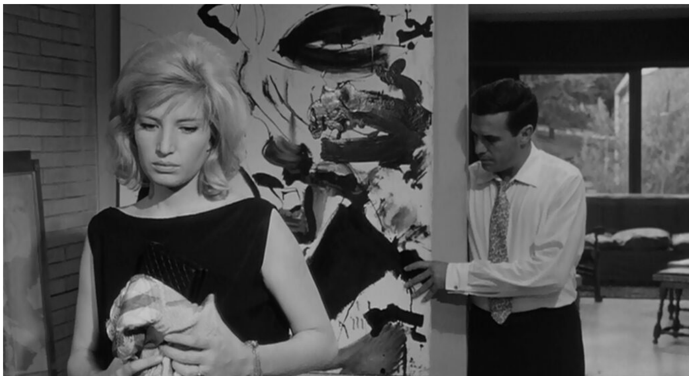
Vittoria (Monica Vitti) și Ricardo (Francisco Rabal) în „L'Eclisse”

lor, dar nu pot decât să se piardă în ele, ajungând la un sentiment neliniștitor al familiarității și acceptării lor tacite. Duc o viață depresivă, dar măcar e depresia lor.